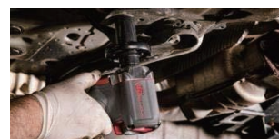
サブフレームボルト