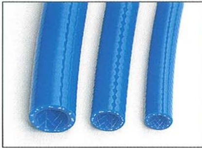
ブレードッドPURホース

ホースの基本型式は、ブレードッド、ノンブレードッドおよびスパイラルの3種で、圧縮空気の使用に当たって生じるいかなる要求も、事実上カバーできます。