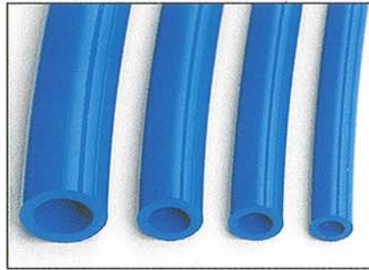
ノンブレードッドPURホース