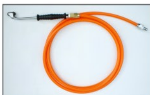
接続ホースφ8x12 (3m×5本) (引っ掛式タイヤチャック) (前輪1本、後輪4本)