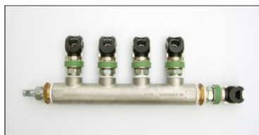
大容量5方分配機 (フルフロー残圧除去・安全ロック付カプラー使用) PAT. 2730598・3354933取得