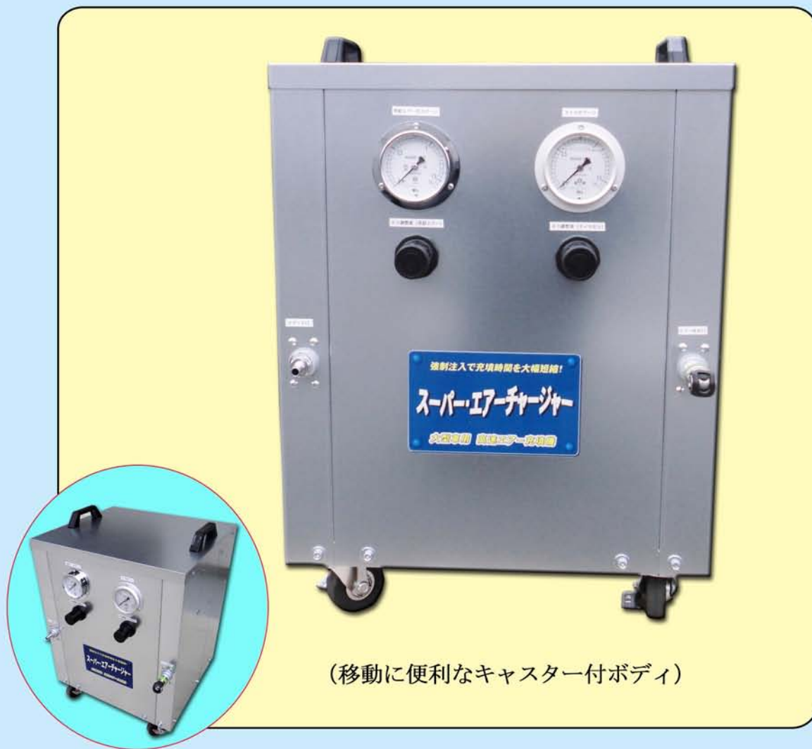
(移動に便利なキャスター付ボディ)

大型バス、大型トラック、トレーラーなどの大型タイヤで実証！ 規定タイヤ圧で安全・省燃費を実現！