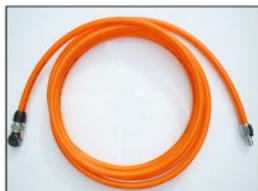
メインホースφ11x16 (5m×2本) (本体～5方分配機用)